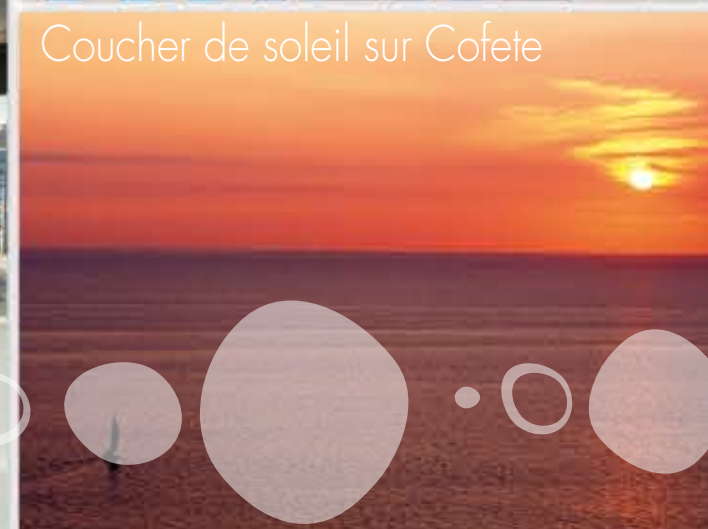
Coucher de soleil sur Cofete