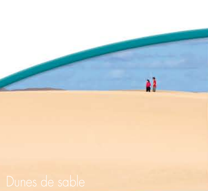
Dunes de sable