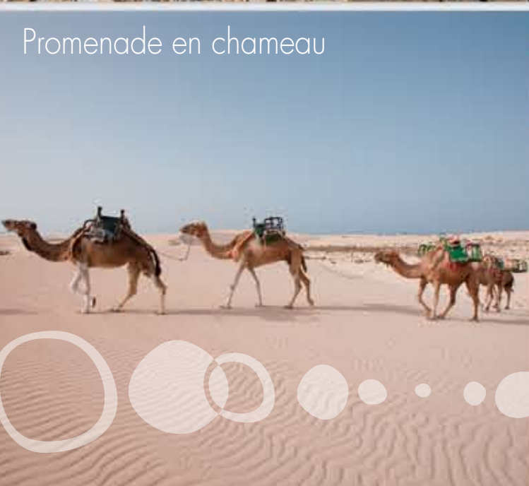
Promenade en chameau