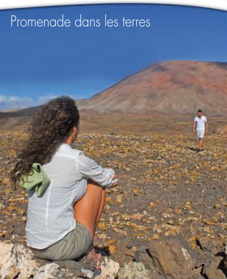
Promenade dans les terres

Piscines, spectacles, stages et autres loisirs multiples permettent aux parents de se détendre et de se reposer pendant que leurs enfants s'amuse et passent du bon temps.