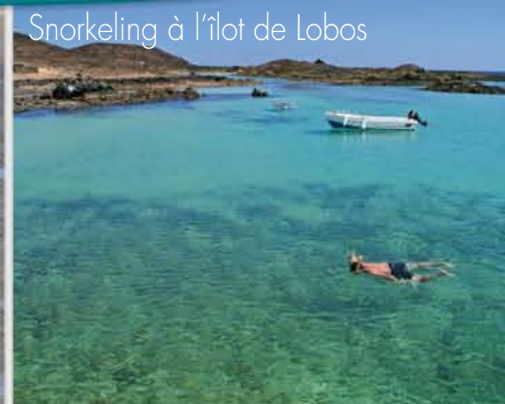
Snorkeling à l'îlot de Lobos