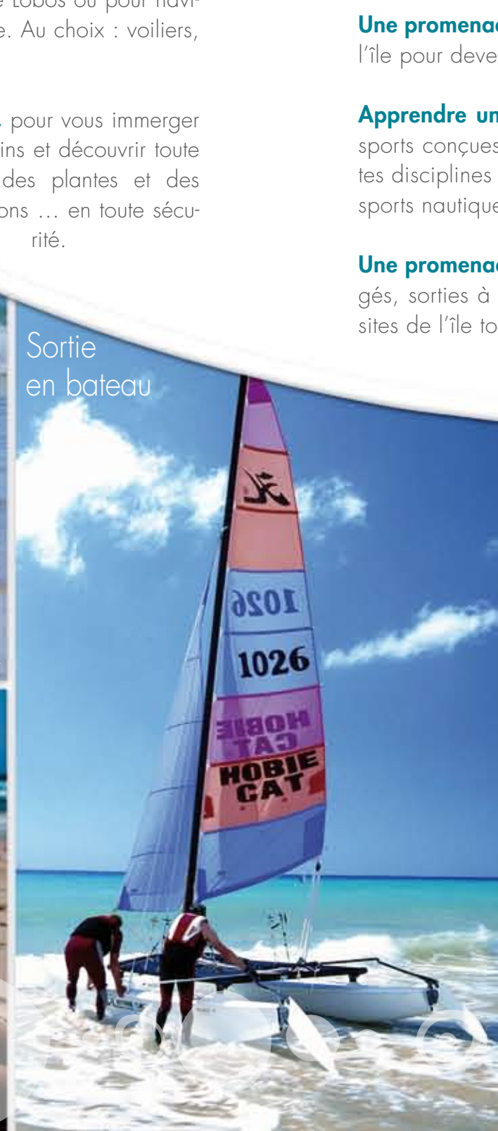
Sortie en bateau