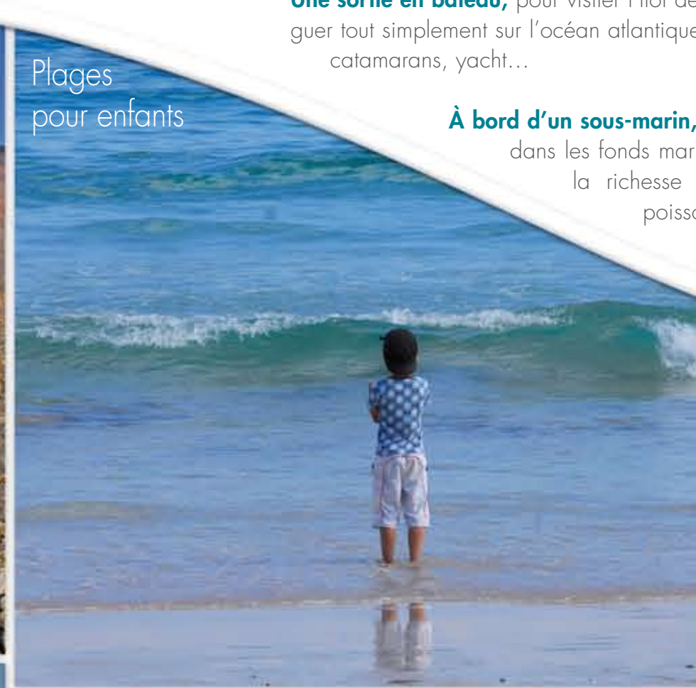
Plages pour enfants