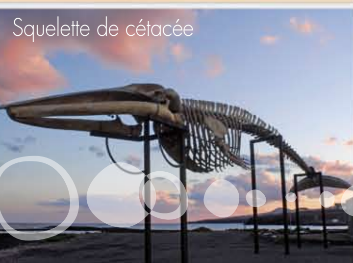
Squelette de cétacée