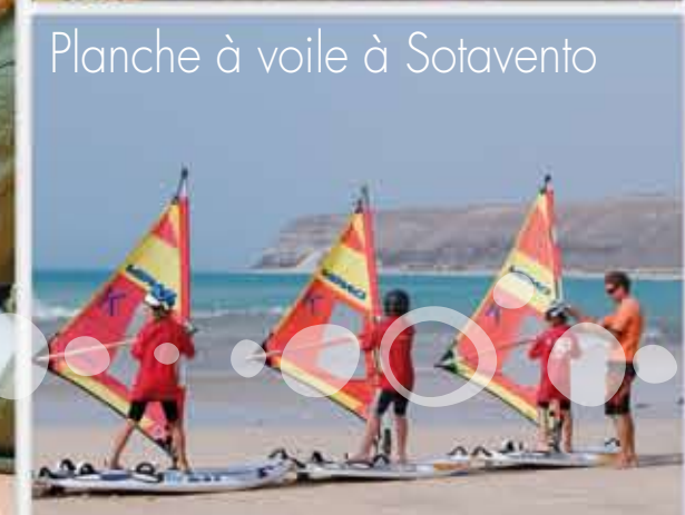
Planche à voile à Sotavento